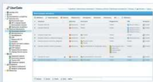
Фильтрация контента в UserGate

UserGate F8000 может обеспечивать безопасность и соблюдение корпоративных политик для предприятий любого размера, а также может использоваться в операторских проектах и для предоставления облачных сервисов.